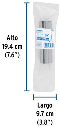
Alto 19.4 cm (7.6")