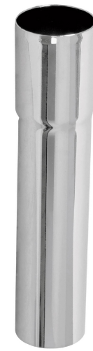
Alto 4" (10 cm)