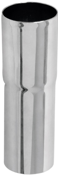
Cuerpo de latón