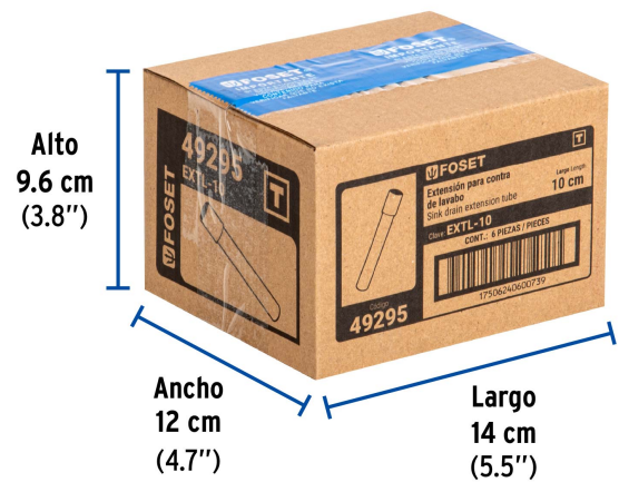
Alto 9.6 cm (3.8")