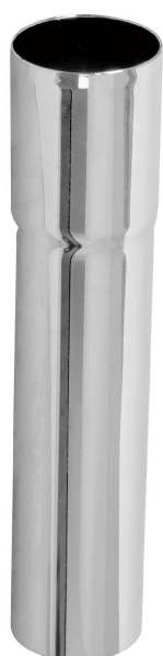
Cuerpo de latón