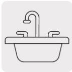
Para tarjas tipo bar