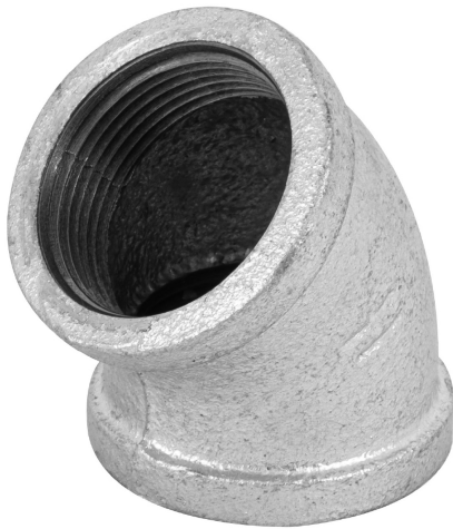
Conexiones roscables de 1 1/4" (32 mm)