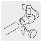
Unión con cemento