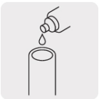
Aplica cemento solvente