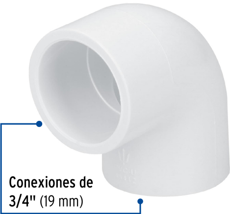
Conexiones de 3/4" (19 mm)

Fabricado en China bajo las estrictas especificaciones de GRUPO TRUPER