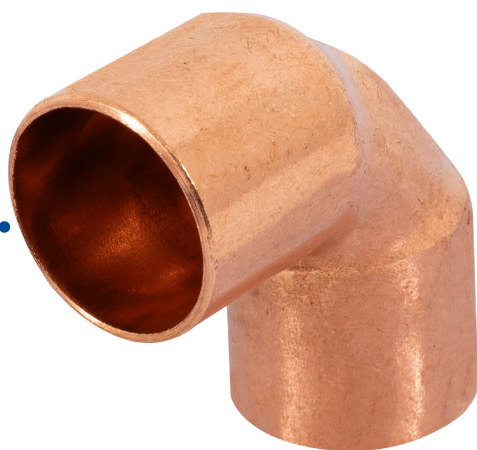
Conexiones soldables de 1/2" (13 mm)