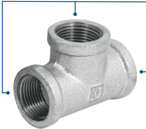
Conexiones roscables de 3/4" (19 mm)