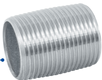
Conexión roscable de 1" (25 mm)