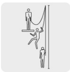
Distancia mínima al suelo desde el punto de anclaje 6 m