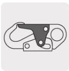
Resistencia de linguete: 3,600 lb (16 kN)