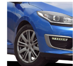
Llantas de automóviles