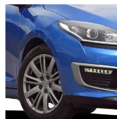
Llantas de automóviles