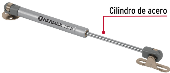
Cilindro de acero