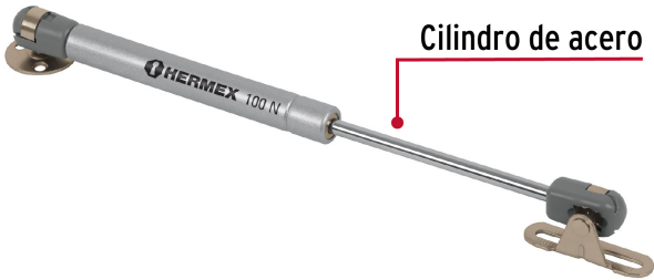
Cilindro de acero