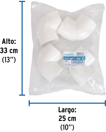
Alto: 33 cm (13")