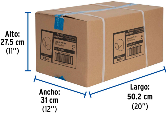
Alto: 27.5 cm (11")