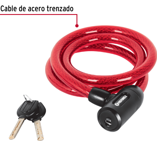
Cable de acero trenzado