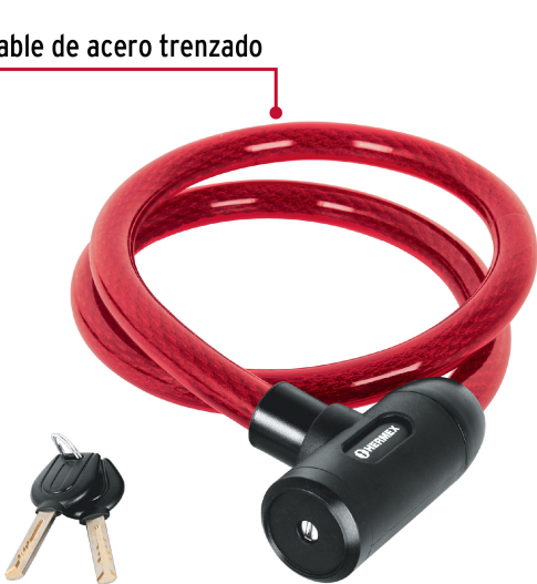
Cable de acero trenzado