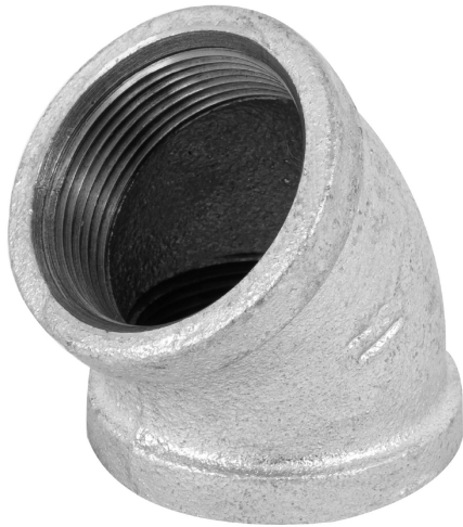
Conexiones roscables de 1 1/2" (38 mm)