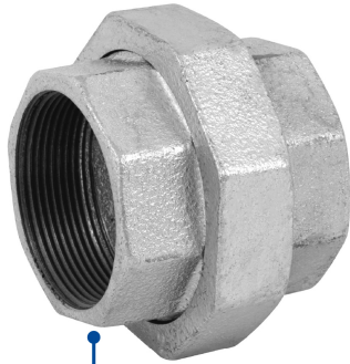
Conexiones roscables de 2" NPT