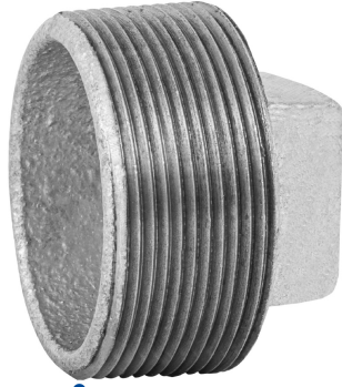
Conexión roscable de 2" NPT