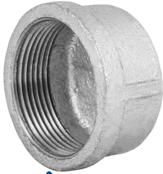
Conexión roscable de 1 1/2" NPT