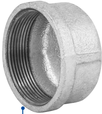
Conexión roscable de 2" NPT