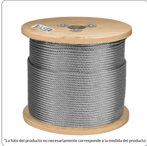
*La foto del producto no necesariamente corresponde a la medida del producto