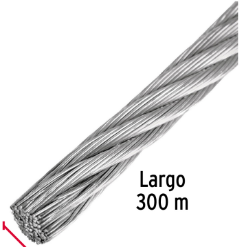
Largo 300 m