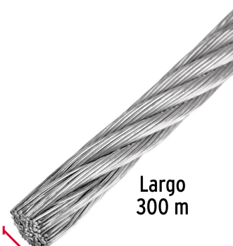
Largo 300 m