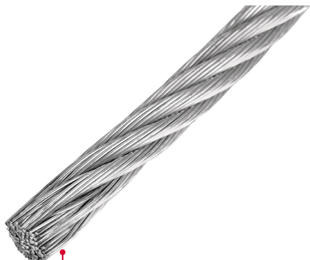
Acero acabado galvanizado