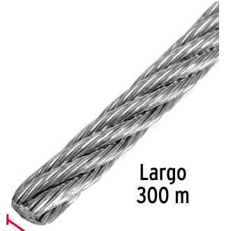
Largo 300 m