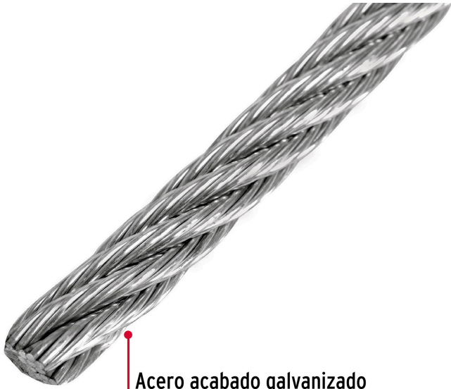
Acero acabado galvanizado