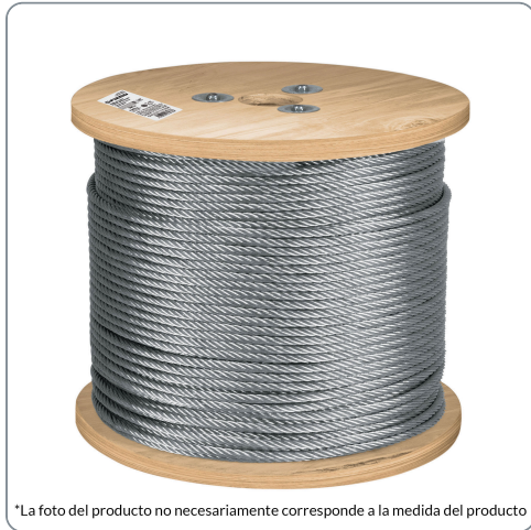
*La foto del producto no necesariamente corresponde a la medida del producto