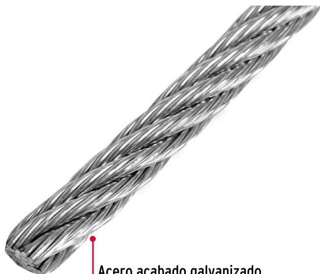
Acero acabado galvanizado