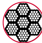
7 x 19 Hilos