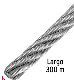
Largo 300 m