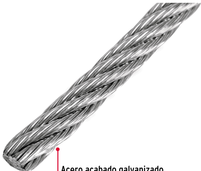
Acero acabado galvanizado