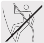
No usar para escalar