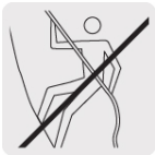
No usar para escalar