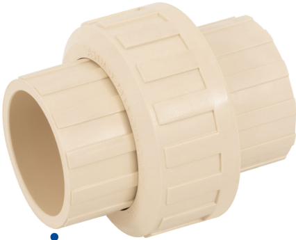
Conexiones de 1 1/2" (38 mm)