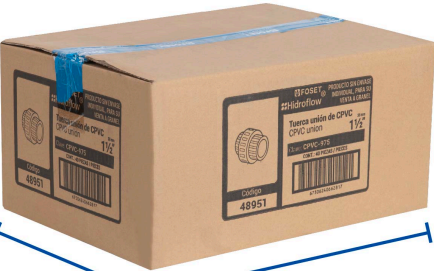
Alto: 20.7 cm (8")