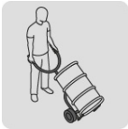
Especial para tambo de 200 L