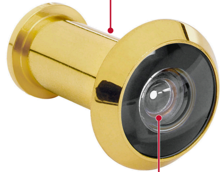
Lente de vidrio