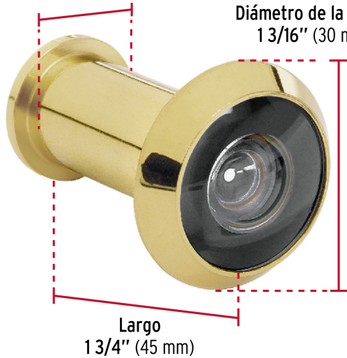
Largo 13/4" (45 mm)