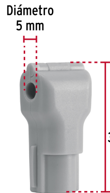
Diámetro 5 mm