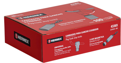
Largo 38 mm