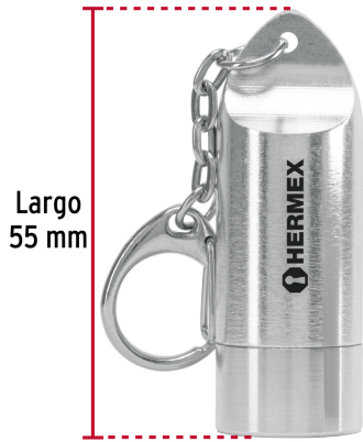
Largo 55 mm