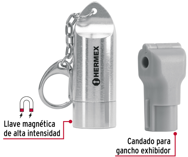
Llave magnética de alta intensidad