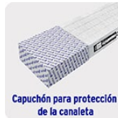
Capuchón para protección de la canaleta