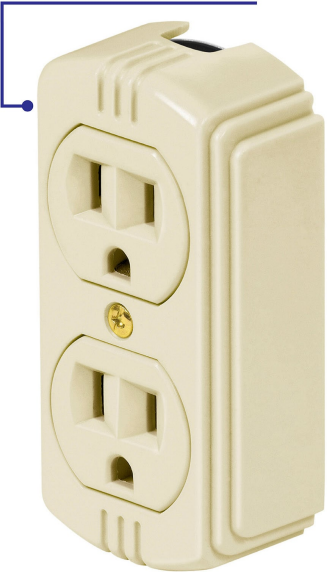
Fabricado en baquelita