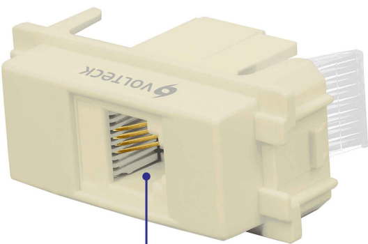
Conector RJ-11 con 4 hilos