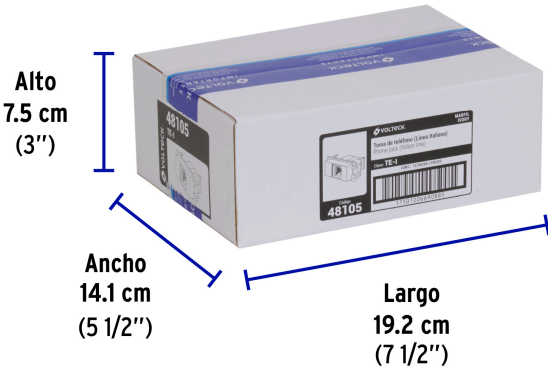
Contiene: 12 piezas