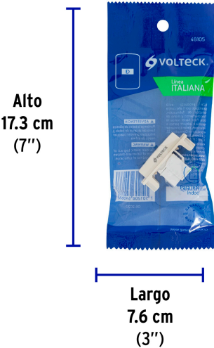
Peso: 0.01 kg (0.02 lb)