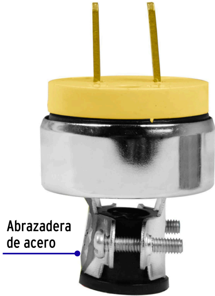
Abrazadera de acero