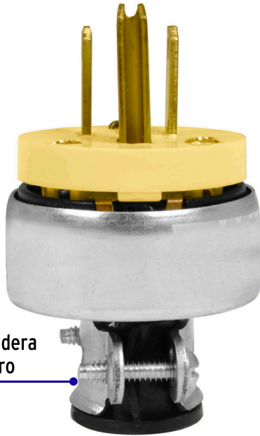
Abrazadera de acero