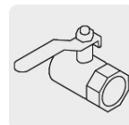
Salida para manguera de 3/4"