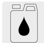
Aceite monogrado SAE30