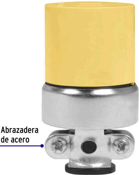
Abrazadera de acero

Fabricado en China bajo las estrictas especificaciones de GRUPO TRUPER