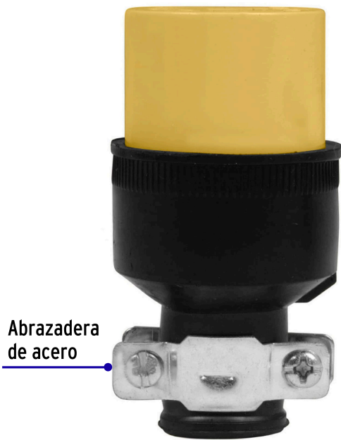
Abrazadera de acero