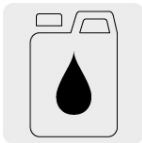
Aceite monogrado SAE30