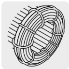
Motor con bobinas de cobre