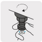
Válvula de drenado