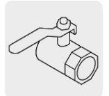
Salida para manguera de 3/4"