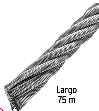
Largo 75 m