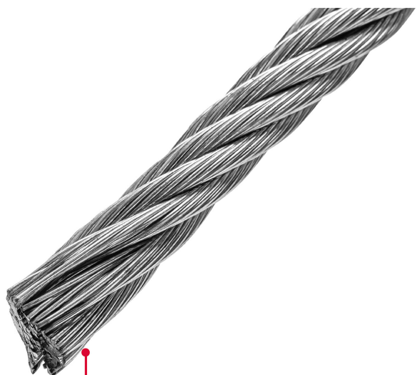
Acero acabado galvanizado