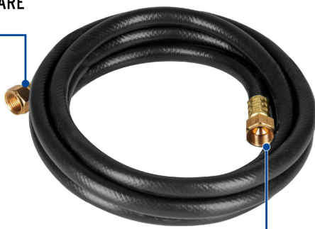
Tuerca 3/8" FLARE de latón