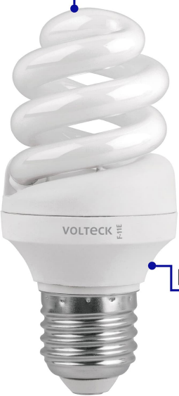
Tubo de vidrio