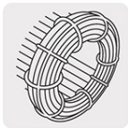
Motor con bobinas de cobre