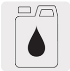
Incluye un bote de 250 ml de aceite monogrado SAE30