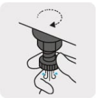
Válvula de drenado