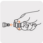
Conexión rápida de latón