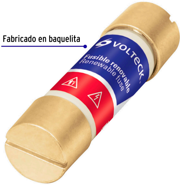
Fabricado en baquelita