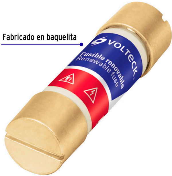
Fabricado en baquelita