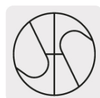
Punta Split Point