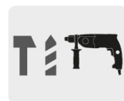
Para rotomartillos SDS Plus