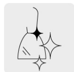
Pulido espejo para fácil limpieza