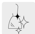
Pulido espejo para fácil limpieza