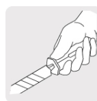
Mango ergonómico con tope para mayor control